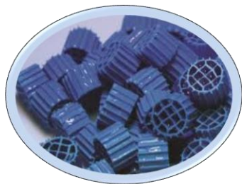
■ ОС-1 фильтрат